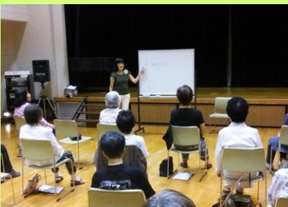
＜英語で脳トレ教室風景＞

高齢化が進む現在、介護を受けることなく元気な老後をいつまでも自宅で過ごせるよう、脳トレ、運動、口腔ケア、栄養などの指導をしていくことを目標にしている。